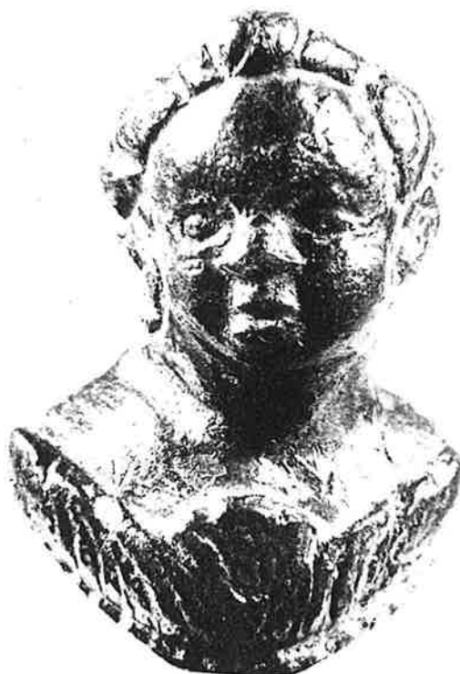
Afb. 22. Bronzen buste uit de tumulus van Sint-Huibrechts-Hern.

Eén van de stijlen was versierd met een bronzen buste (afb. 22) van een vrij goede kwaliteit.