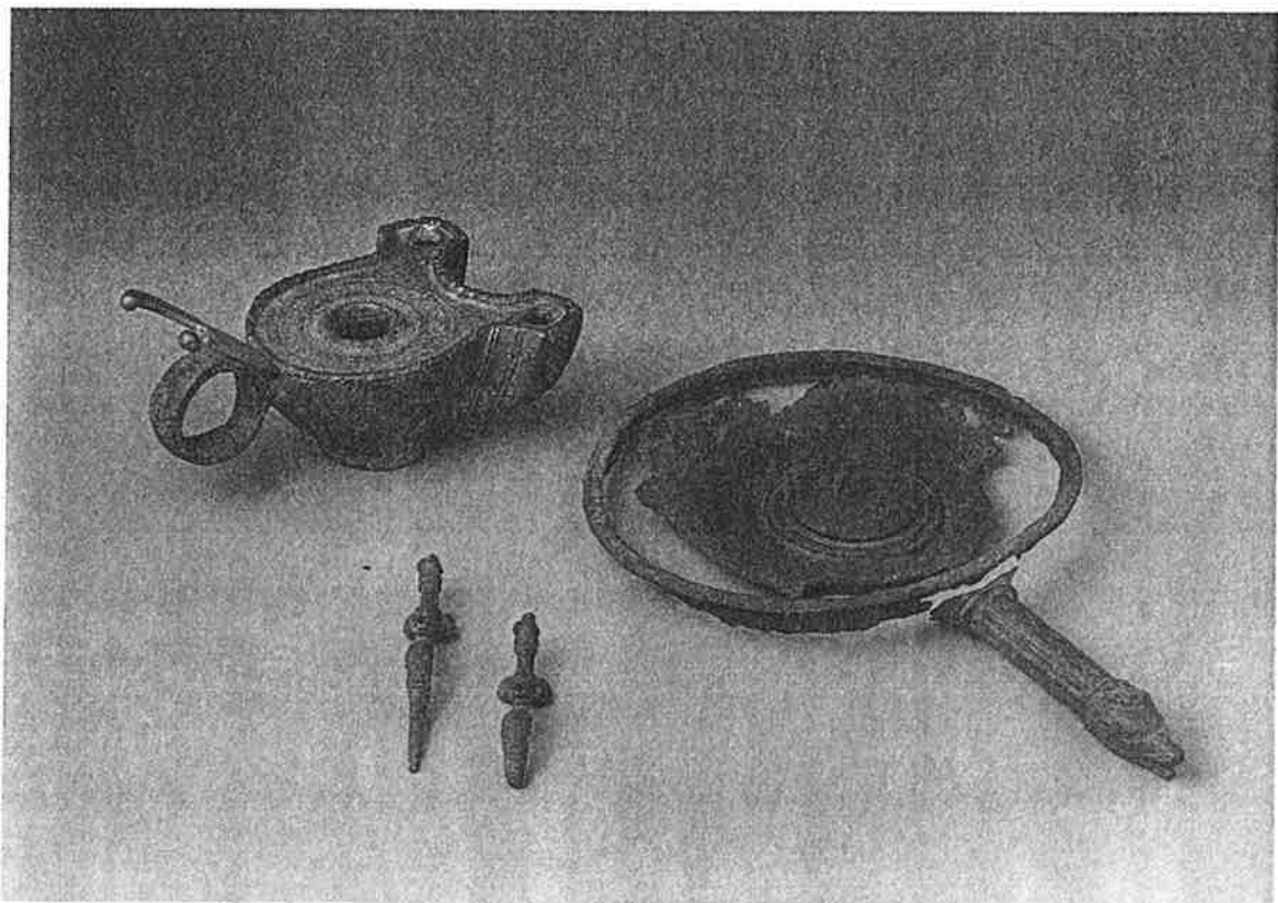
Afb. 21. Bronzen lamp, patera en fragmenten van een versierde kandelaar uit de tumulus van Sint-Huibrechts-Hern.

Naast de brandresten van de overledene troffen de onderzoekers een grote hoeveelheid glas, aardewerk, bronzen vaatwerk, soms met sporen van verguldsel, en ook jachtwapens (?) aan. Enkele stukken van het ritueel servies zoals een sterk beschadigde bronzen oenochoë, voorzien van een prachtig uitgewerkt oor dat versierd was met genii en een pieta, en de bronzen patera, waarvan de gecanneleerde steel eindigde in een grijnzende wolvenkop, getuigden van een groot vakmanschap van de makers. De pootjes van een bronzen kandelaar droegen uitgewerkte leeuwe- of panterkoppen met opengesperde bek. Tenslotte gaf een grote bronzen lamp voorzien van twee tuiten en een symbolische maansikkel, versierd met gegraveerde cirkels en guirlandes, licht aan de dode in het hiernamaals (afb. 21).